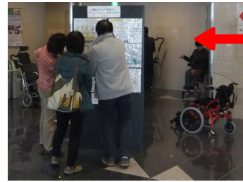
また、ロビーの一角をお借りし、「福祉用具が活用しやすい住環境設計」について実例の検討図面や提案資料を展示させていただきました!

----- 参加いただいた全ての方に改めて感謝申し上げます。<ふくせん長崎県ブロック一同> -----