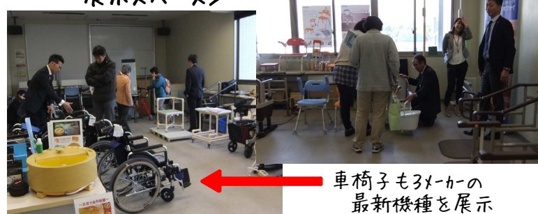
車椅子も3メーカーの最新機種を展示