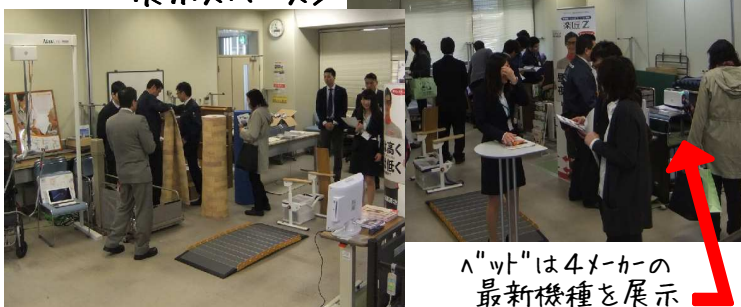
ハットは4メーカーの最新機種を展示