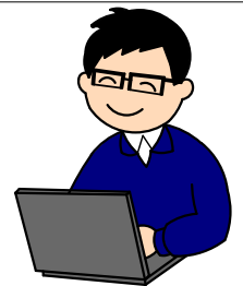
(株)カイダ・アイフルケア 福祉住環境設計室 管理建築士

※今回は「セミナーの動画配信」や「資料公開」の予定はありません。この機会に是非ご来場下さい。