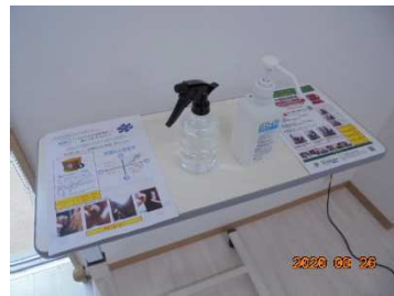
本社ショールーム（説明風景）