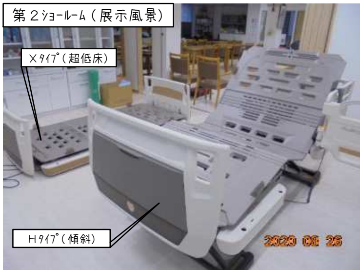
第2ショールーム（展示風景）

・8月25、26日に長崎・諫早の2つのショールームで「楽匠+ 内覧会」を行い、無事に完了することが出来ました。